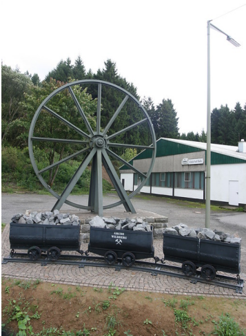
Grubenrad Wildberg (2017)